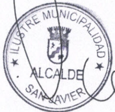
PEDRO FERNANDEZ CHAVARRI ALCALDE ILUSTRE MUNICIPALIDAD DE SAN JAVIER