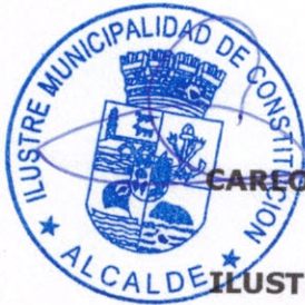
CARLOS MOISÉS VALENZUELA GAJARDO ALCALDE ILUSTRE MUNICIPALIDAD DE CONSTITUCIÓN