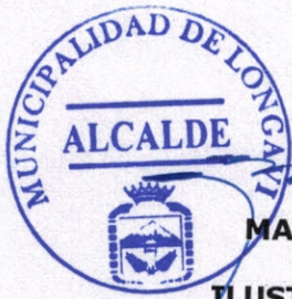
MARIO BRIONES ARAICE ALCALDE ILUSTRE MUNICIPALIDAD DE LONGAVÍ